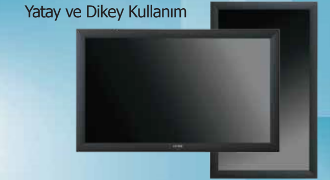
DOKUNMATIK PANEL PC