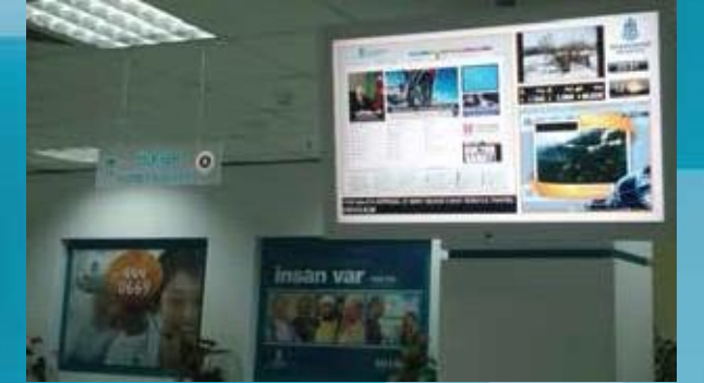
Yatay ve Dikey Kullanım

İnsanların yoğun olduğu noktalarda vazgeçilmez ekranlar